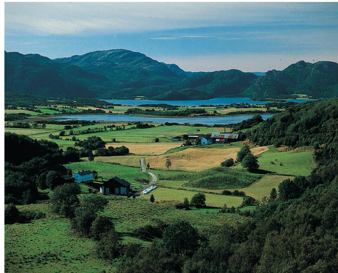
Kulturlandskap med Litjvatnet og Storvatnet ved Mølnbukt, Agdenes