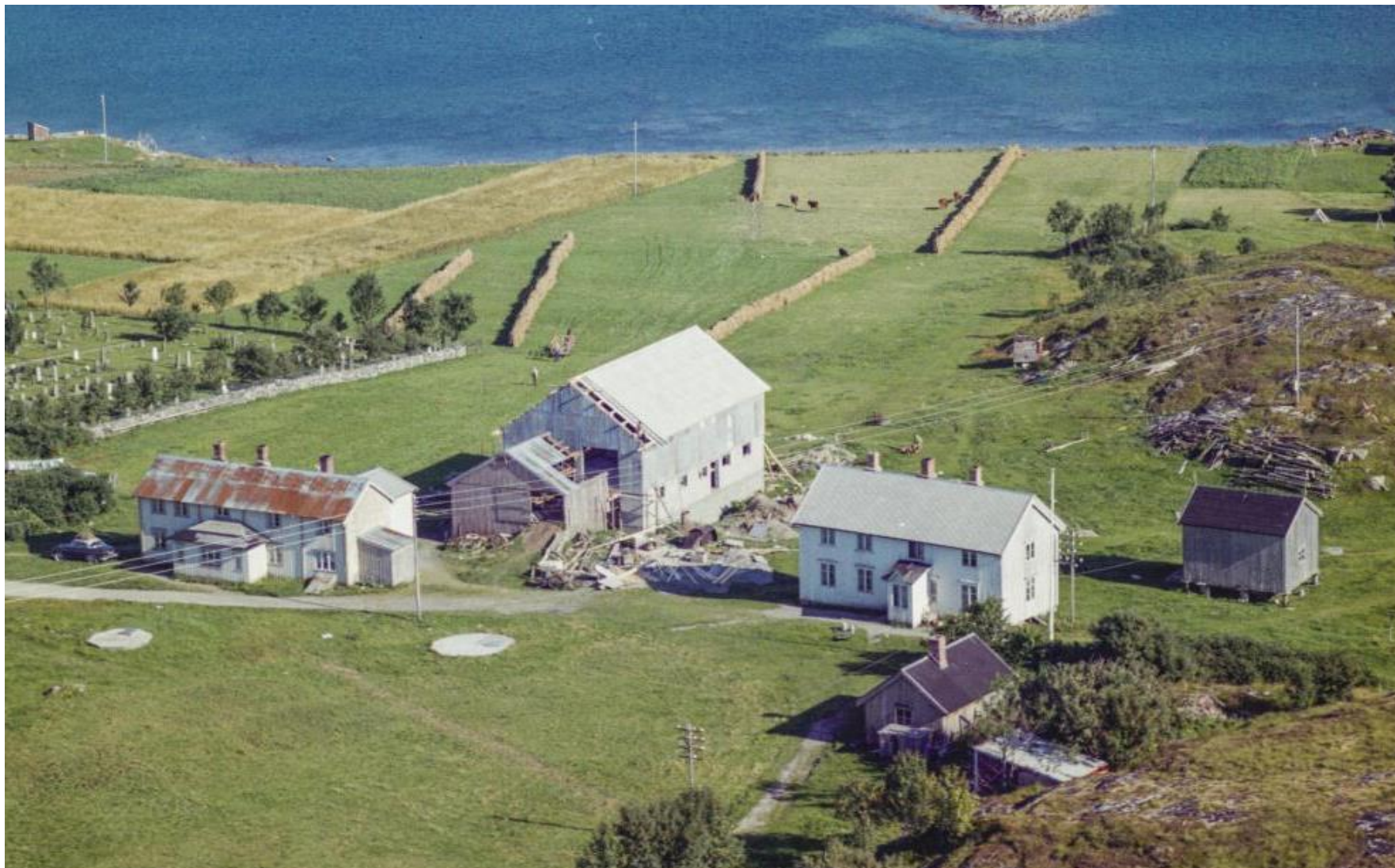
Gårdstun på Værnes, ca 1965. Begge våningshus står i dag.