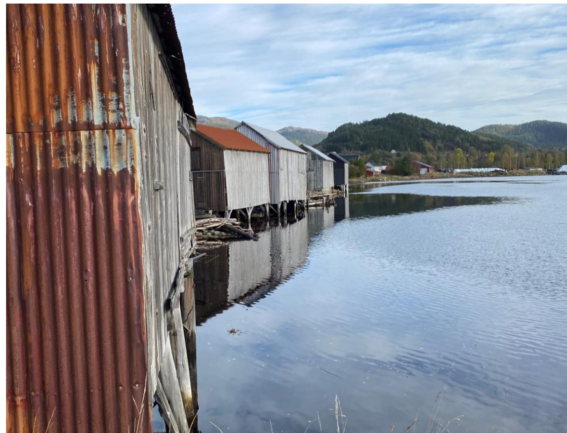
Naustrekke, Krokstadøra, Snillfjord