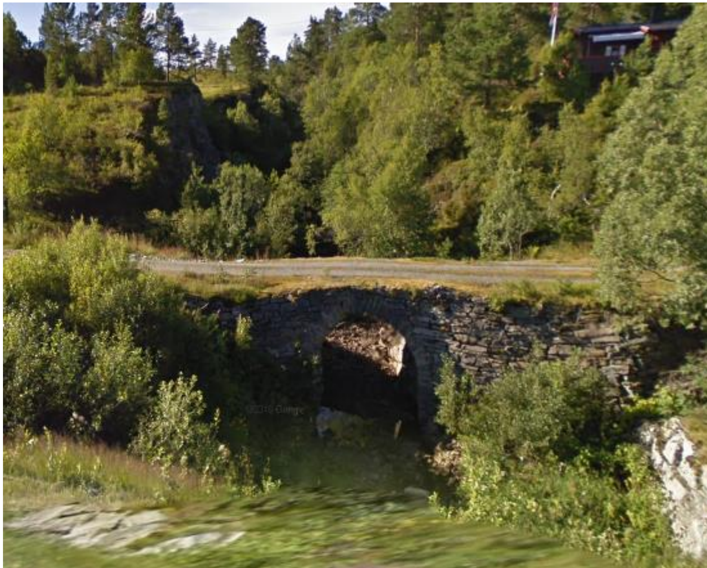
Steinbru ved Ellingsgården, Søvatnet.