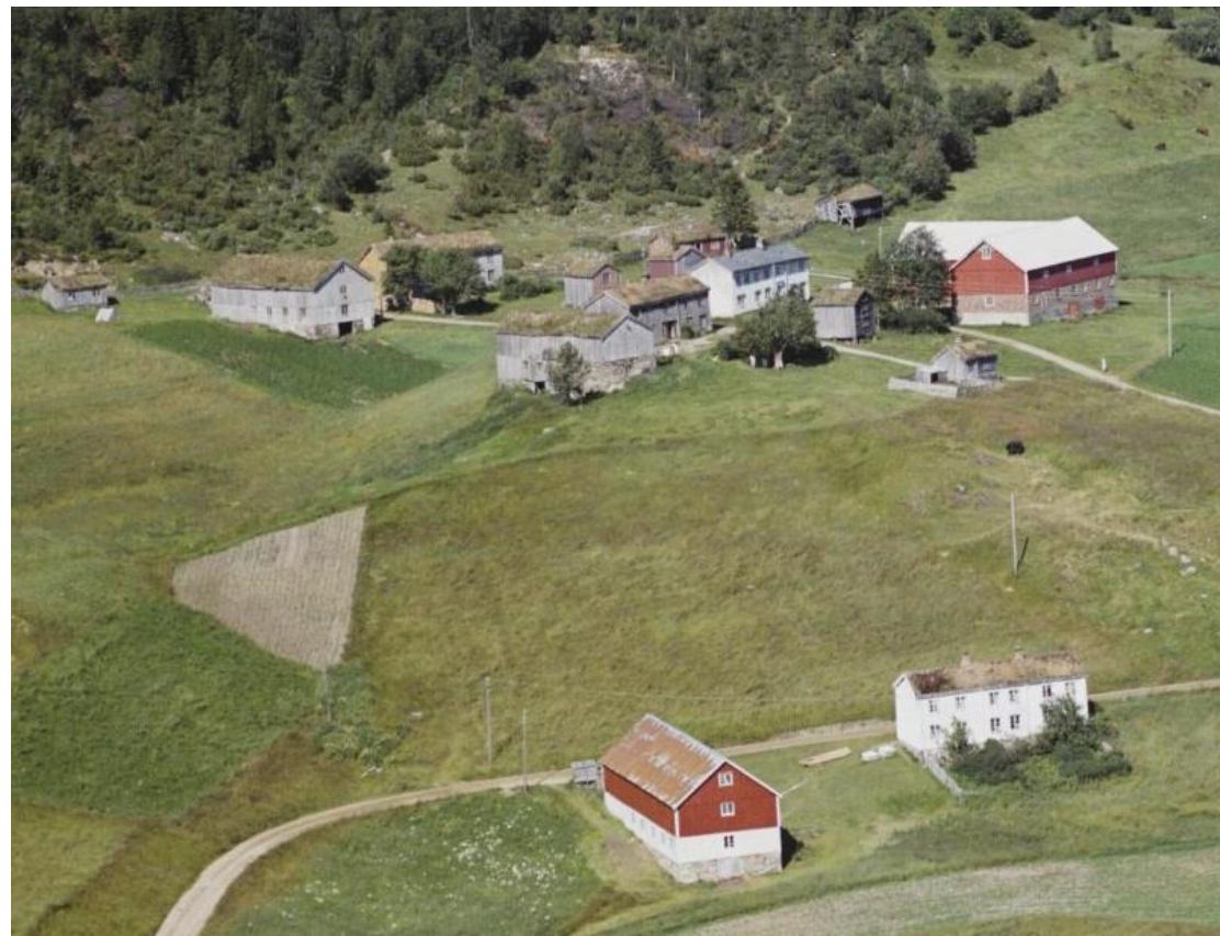
Berg, Snillfjord (1965)