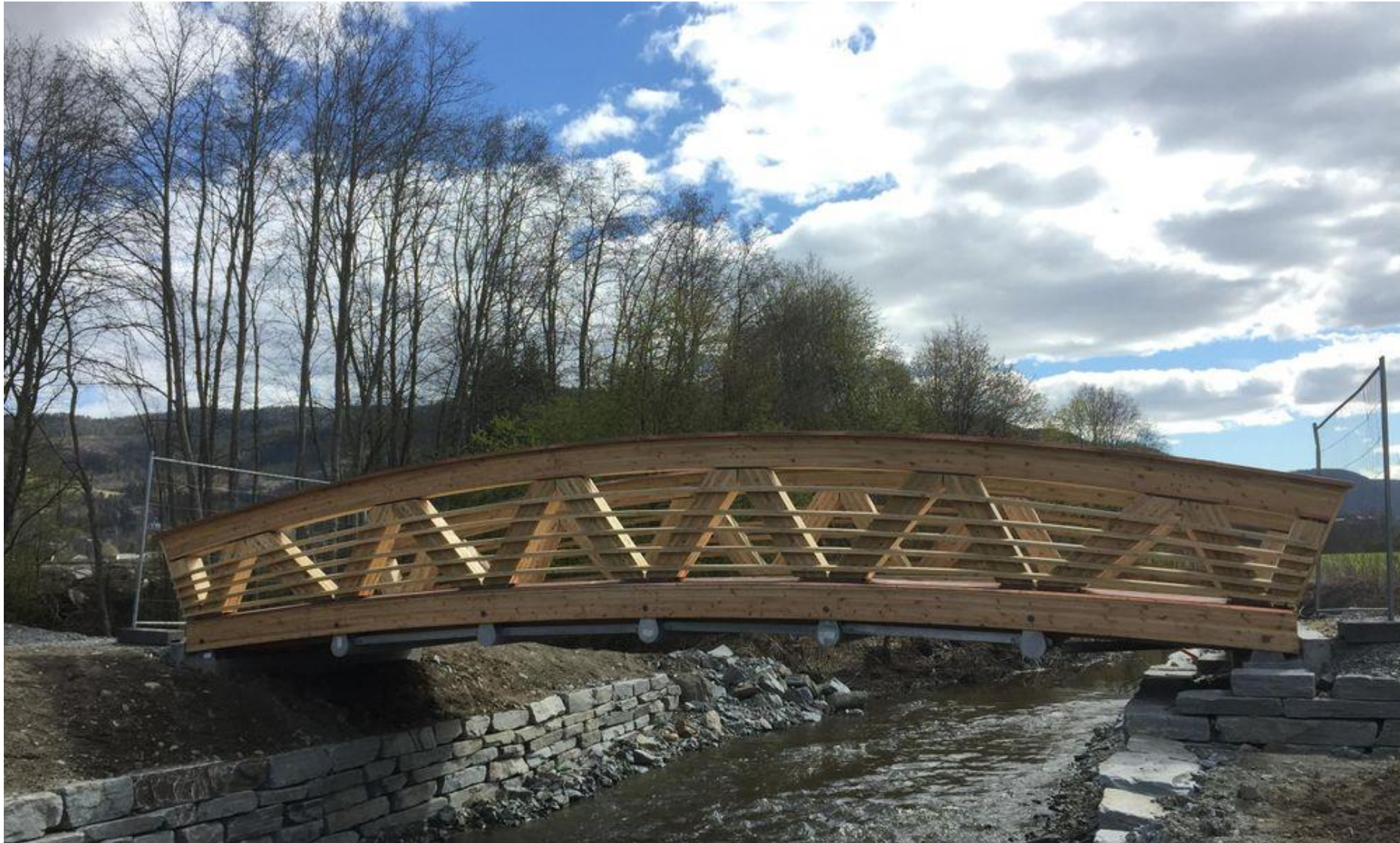
Trebru 2018 over Follobekken/Evjensbekken i Orklaparken.