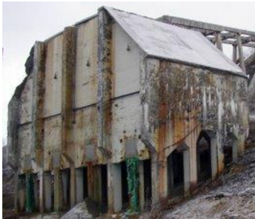
Det gamle Vaskeriet ved Løkken Verk