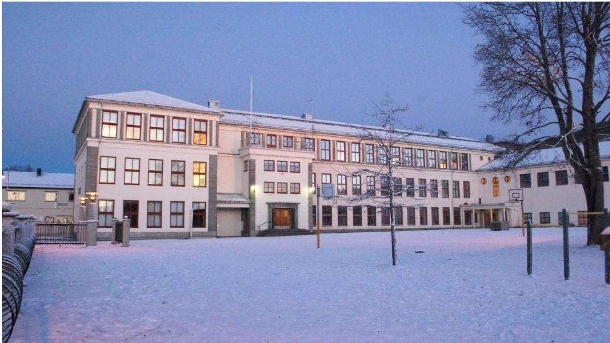
Orkanger barneskole fra 1939.