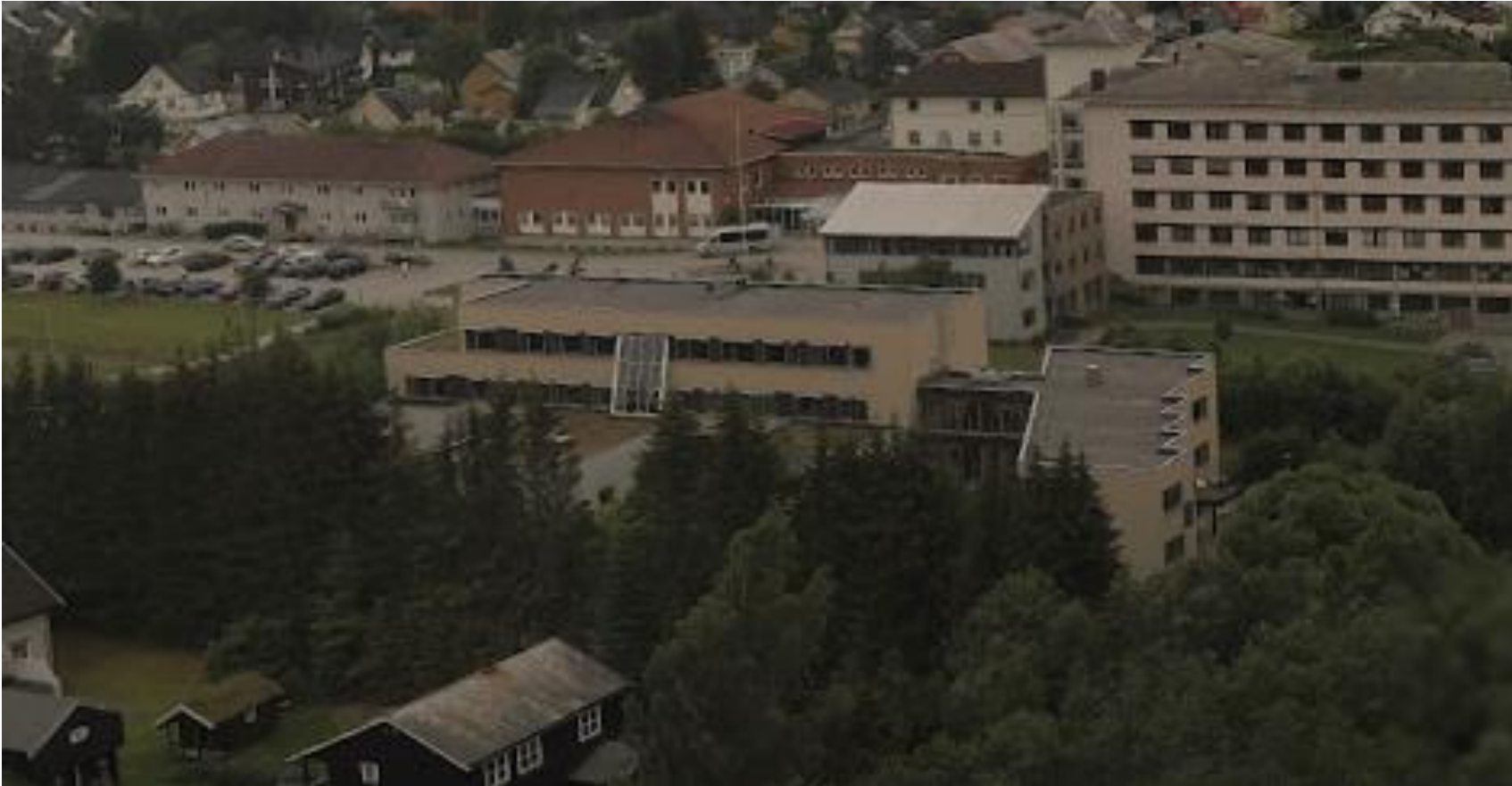
DPS Døgnpsykiatrisk avdeling, Orkdal sykehus