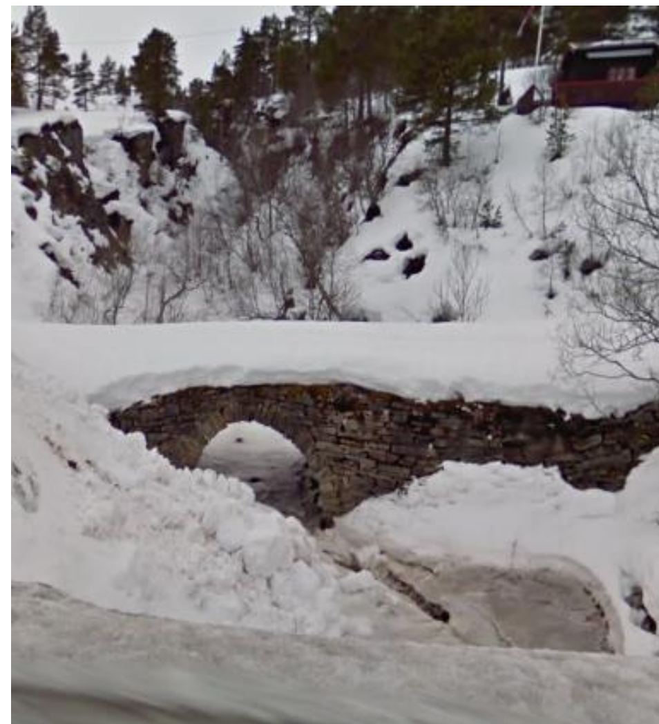
Steinbru ved Ellingsgården.