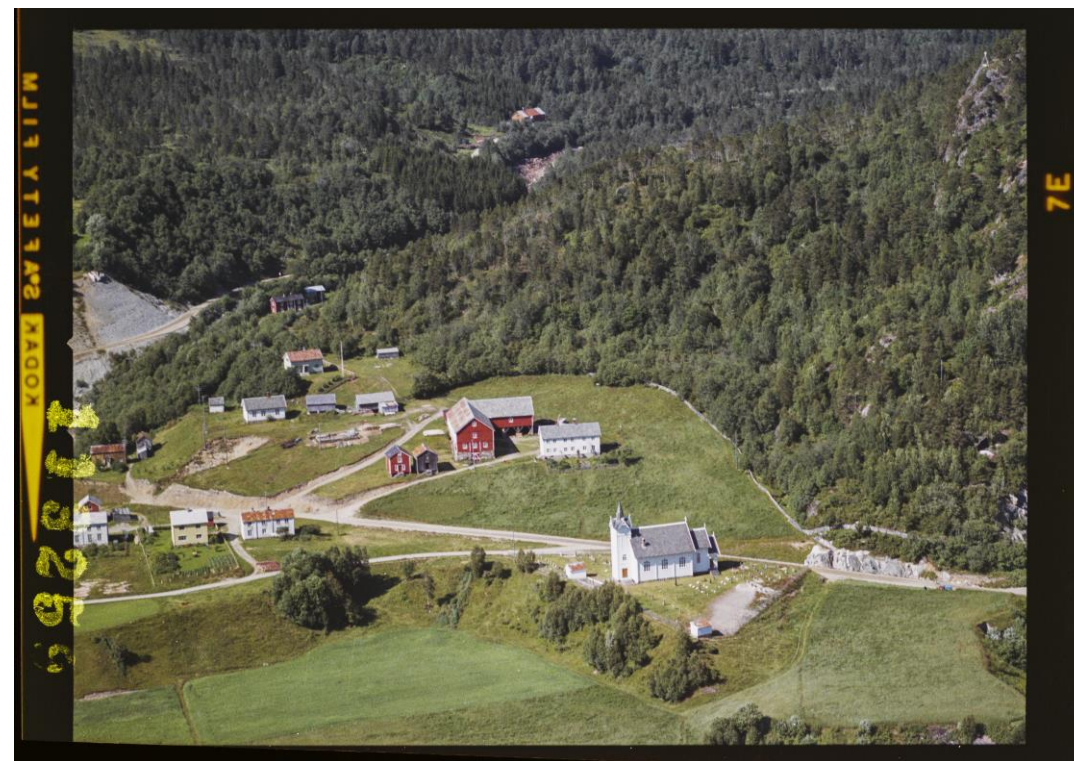
Snillfjord Kirke, 1960-1966